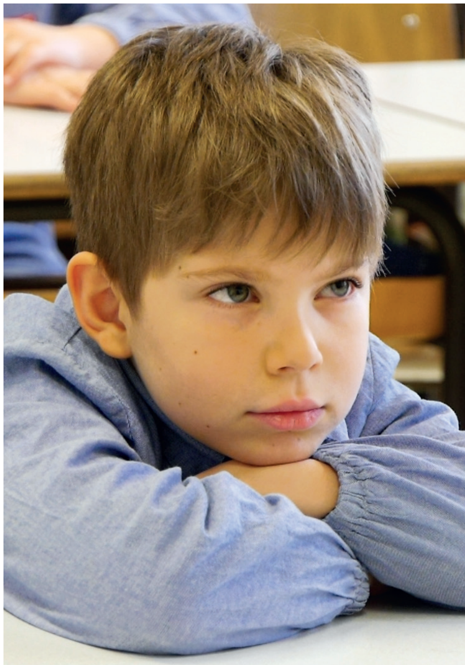
Istituto Comprensivo Perugia 3 - Scuola Primaria « XX Giugno », Pérouse, Italie